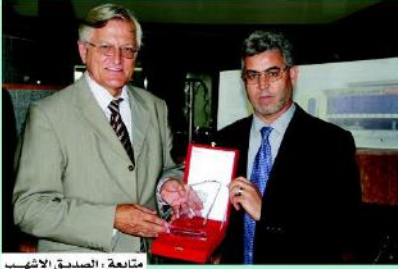
متابعة ، الصديق الأشهب