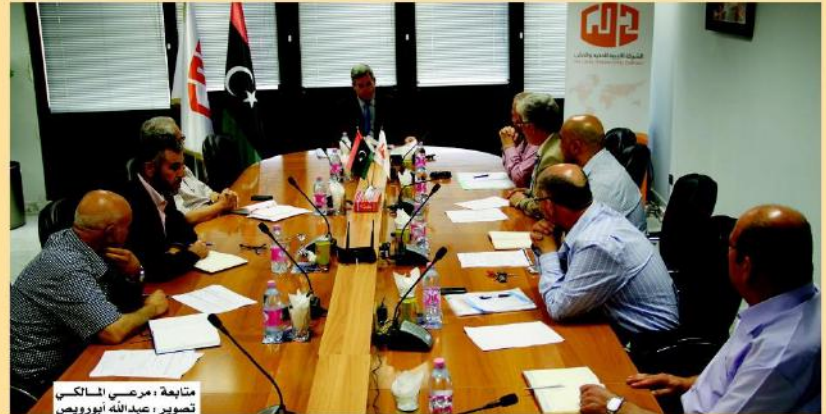
متابعة ، مرعي السكسي

مجمدة النشاط، أو تفعيلها و معاودة نشاطها، أو تصفيتها. وكانت النتيجة التي توصل إليها المجتمعون، هي الإبقاء على "misc" مجمدة النشاط، مع إمكانية تفعيلها عند الحاجة إليها للاستفادة من اقدمية تسجيلها في الغرفة التجارية. كما تم التطرق في الاجتماع أيضاً إلى الخسائر المرحلة والديون الخاصة بالشركة، وقد تم الاتفاق على أن تتم معالجتها محاسبياً من طرف الشركة الليبية للحديد والصلب.