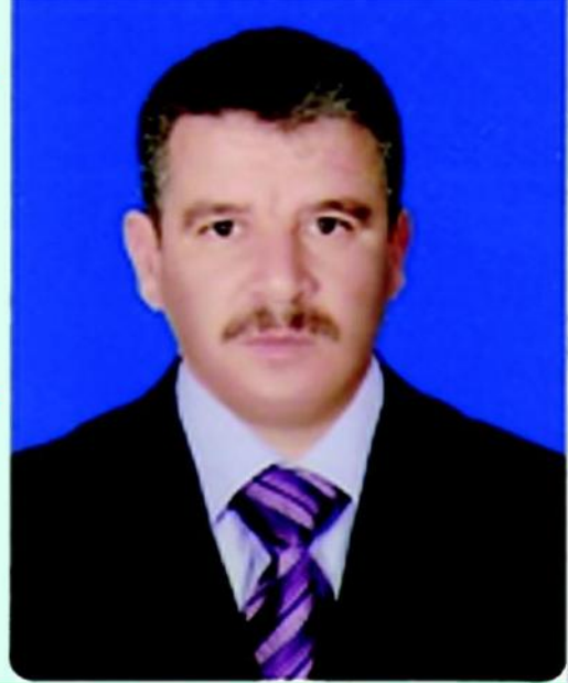
حاوره محمد الأمين

- تغيير أنظمة العمل بالشركة بين الفينة والأخرى كان تمشياً مع توجيهات الدولة. - لجنة شؤون العاملين هي المختصة بالنظر في التظلمات الخاصة بالدرجات الوظيفية.