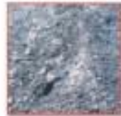
شكل (5) مخلفات المعالجة

تتساقط هذه الأكاسيد نتيجة للمعالجة الكيميائية للضات المدرفلة على الساخن حيث تفصل عن حامض