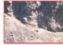
شكل (8) الغبار الناتج

ينتج الغبار عن منظومات السيور الناقلة للحديد المختزل إلى أفران