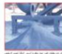
شكل (9) قشور Scales

الإختزال المباشر. وتستقبل مسحوق الحديد المختزل القادم من محطة غرنية الإنتاج بواسطة منظومة السيور