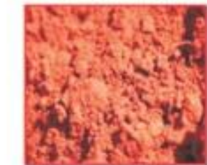
شكل (6) أكاسيد المعالجة

وهذه العينات تم تجميعها على فترات ومن ثم تحليلها بالمختبر المركزي التابع لإدارة مراقبة الجودة. ويلاحظ ارتفاع نسبة الأكاسيد في غبار الأفران