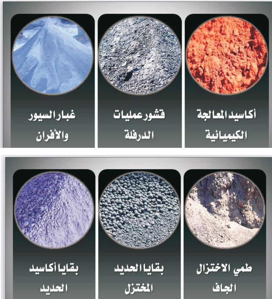
غبار السيور والأفران