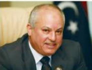
التعاون إعادة استثمار البتس التحتية الأساسية في البلاد من طريق مستشفيات فمرت خلال حرب التحرير في 2011.

طرابلس 13 مارس 2013 (أول) - أعلن وزير النفط والغاز السيد "عبد البري العريسي" أن ليبيا ستولي منح امتيازات نضوية جديدة قبل نهاية 2013 في بادره في الأولى منذ ست سنوات وقال العريسي في مقابلة مع وكالة الصحافة الفرنسية "لنحياح بعض الوقت ولكن في الربع الأخير من هذه السنة ستمتكم العمل الدراسة ونضمان من جولة جديدة من الاتفاقيات الاستكشافية". وأكد الوزير وجود "طلب كبير" من شركات النفط الأجنبية الرغية في العمل في ليبيا مضيفا أنها "بلد واعد وفيه مساحات كبيرة لم تستكشف بعد". على الأخرى وزير البحر، وذكر العريسي من جهة أخرى أن ليبيا ستوطلب أيضا من إنتاج النفط كاري منظمة أولك من 1.9 مليون برميل في اليوم في 1.7 مليون. وقال "ستطلب حصة اضافية في الاجتماع القادمة للمنظمة". وأوضح الوزير أن ليبيا المصدر الرئيسي للنفط في أفريقيا بصحابة في إنتاج المزيد