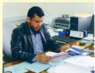
إدارة النقل والعامل

عقد لستة أشهر بـ 73 ألف دينار 300 راكب يوميا .. وللحافلات مناشئة أخرى