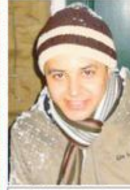
حسام الدين الثني

حينما اجتمعت الحروف الهجائية وصاغت بيان قمتها الختامي، كانت قد وضعت حدود خارطتها الجغرافية. جاء في بيانها أن عددها ثمانية وعشرون حرفاً لا أكثر ولا أقل، كانت لهذا الحدث تبعته الخطيرة التي دفعت (لام الألف) للتقدم بطلب إعادة النظر في البيان وإضافته إلى بقية الحروف لتصبح بذلك تسعة وعشرين.