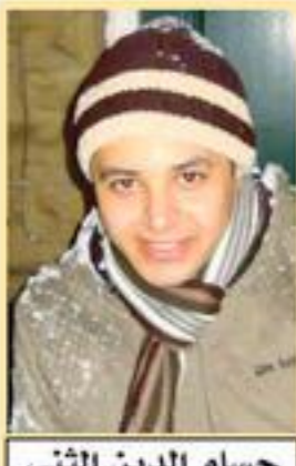
حسام الدين الثاني

- أشعر بما تشعربه، تعلم ذلك لكن ما بيدي حيلة! هزه ما قلت فأدار ظهره مبتعداً ودفن رأسه تحت جناحه. اهتزت كتفاه دونما توقف. كان يبكي، قلبي المسكين