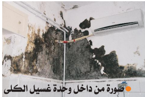
● صورة من داخل وحدة غسيل الكلى

قام وفد من إدارة الشركة بزيارة لوحدة غسيل الكلى بالزروق للوقوف على حجم الأضرار التي تعصف به والتي كادت أن تصل بل إنها وصلت به لحد التوقف وهو ما يعني أن حياة المصابين بهذا المرض العضال قد أصبحت مهددة بالفعل الأمر الذي جعلهم وذويهم ينظمون وقفة احتجاجية مطالبين بتوفير متطلبات الغسيل اليومي ،