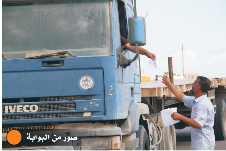
صور من البوابة

في الحقيقة هناك بعض الحالات ولكن لا نستطيع أن نضمنها على أنها أعمال إرهابية فمثلاً هناك بعض من مخلفات حرب التحرير من ذخائر وقذائف تأتي مع الخرقة بشكل غير متعمد فنقوم بالاتصال بسرية الهندسة العسكرية مشكورين على تعاونهم معنا للتعامل مع هذه الأشياء التي هي نادراً ما تحدث وتم كشفها قبل دخولها للأفران.