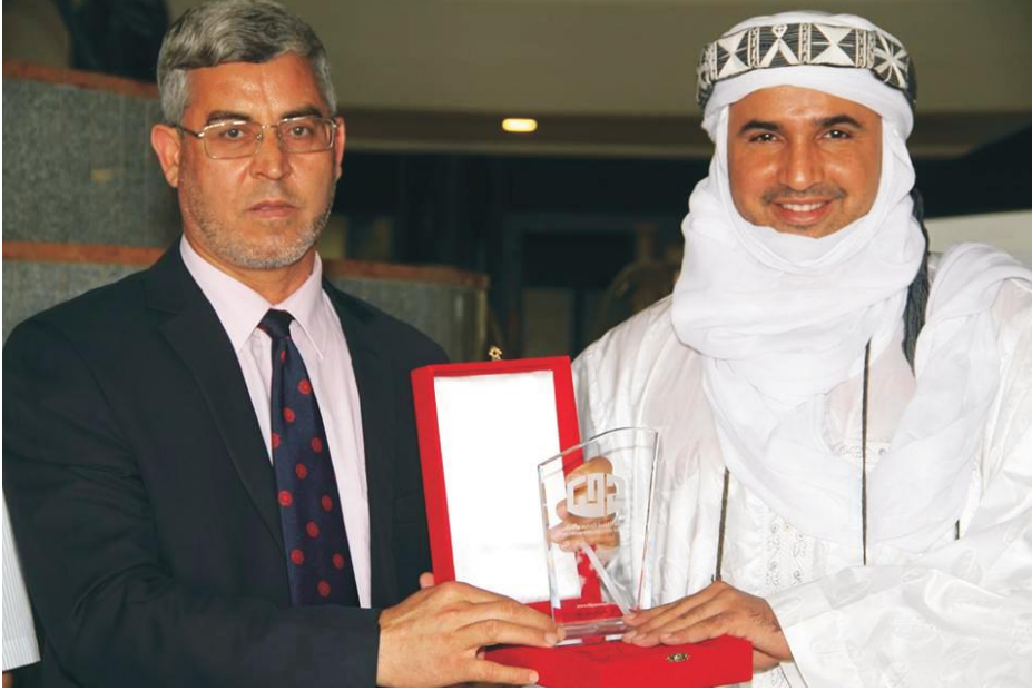
رئيس مجلس الإدارة يسلم درع الشركة للمستشار الأول لرئيس جمهورية النيجر