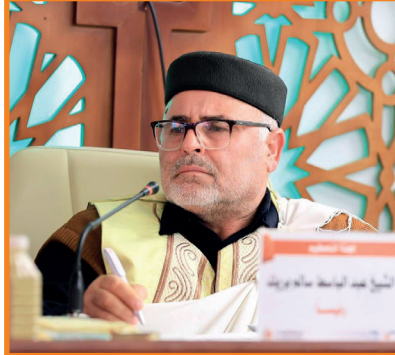
الشيخ عبدالباسط بريك: